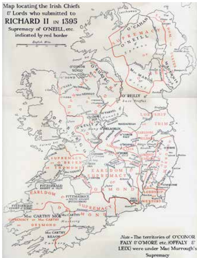
Ierland in 1395, wel heel veel grenzen

ging als volgt: met gebogen knieën en met gevouwen handen kwamen ze bij de koning die zijn handen om de gevouwen Ierse handen sloeg en de eed van onderwerping in het Iers aanhoorde. Van zo'n gebeurtenis werd een Latijnse notariële akte opgemaakt. 38 van deze notariële akten zijn overgeleverd, waarvan tien in origineel. Veel akten zijn opgemaakt in