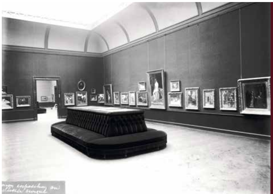
De tentoonstelling in het Stedelijk Museum van 1909 met rechts Bij de notaris