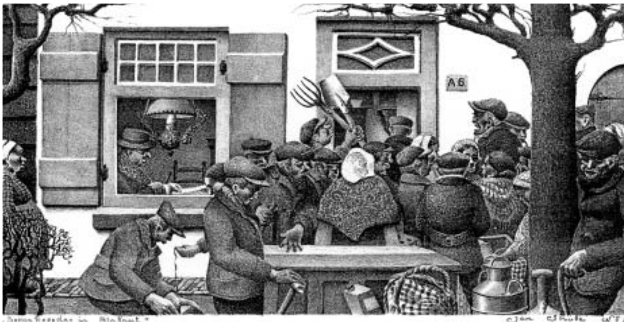
De boerennotaris aan het werk.

Litho: Boerenkoopdag in Brabant, Johan Hendrik Strube, begin twintigste eeuw (eigen collectie)