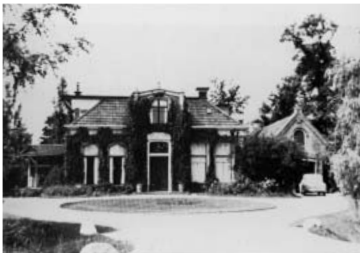
Osinga State, illustratie uit: Oude en nieuwe notarishuizen in Friesland, VNAL, 1985