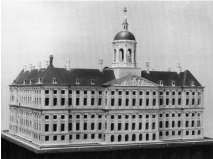
Jacob van Campen, schaalmodel van het stadhuis in Amsterdam in eikenhout, 1648

Aan de hand van notariële en gerechtelijke archieven kon over het optreden van Van Campen nog heel wat worden gereconstrueerd