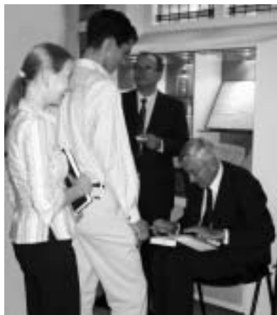
Signeersessie, 5 september 2003

De redactie van de Ponder vraagt auteurs van recente Ars Notariatusdelen te beschrijven hoe hun boek is ontstaan, wat de opzet ervan is. Het resultaat daarvan treft u hieronder aan. Niet zo maar recensies, maar persoonlijke beschouwingen van de schrijver.