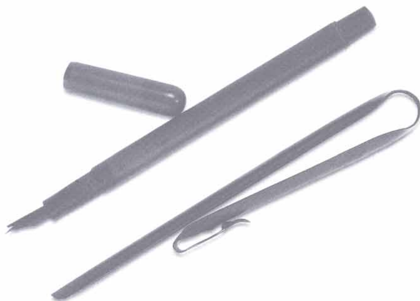
Bakelieten vulpen met ijzeren houder (zie pag. 5)