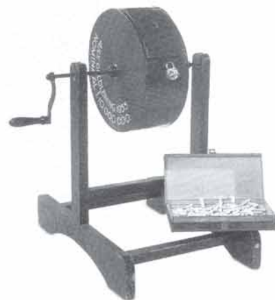
Trommel voor trekking van de woningbouwpremielening van de gemeente Amsterdam 1951

De draaitrommel behoort nu tot de collectie van onze stichting.