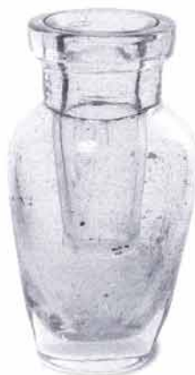
Glazen inktpot (zie pag. 5).