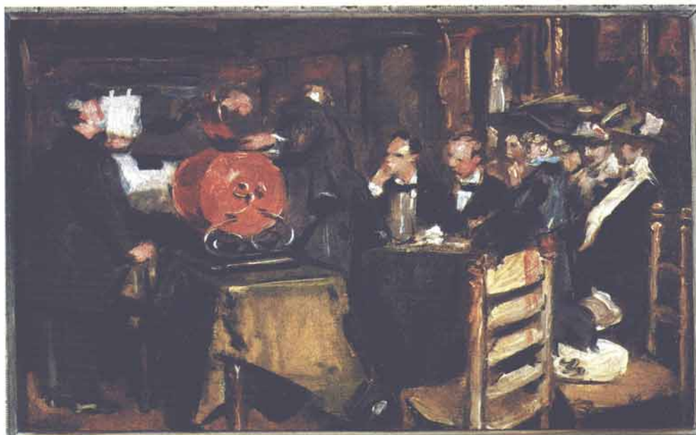
Loterij op Arti, Martin Monnickendam, 1913

“Wij zijn er te oud voor: doe jij het maar”