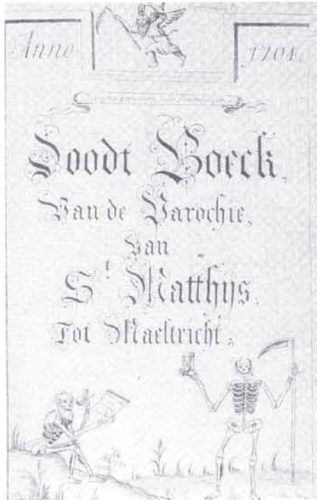
Titelpagina van het overlijdensregister van de parochie Sint-Matthijs (Sinte-Catharina) te Maastricht, 1704