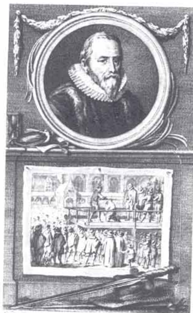
Terechtstelling Johan van Oldenbarnevelt

dat in 1909 door een particulier aan de gemeente was aangeboden ter opsiering van het nog te bouwen stadhuis aan de Coolingsingel. Het toeval wilde dat het raadsvoorstel om deze schenking te accepteren geagendeerd stond voor de raadsvergadering van 13 mei (1) 1909. De geboorte van prinses Juliana op 30 april van dat jaar werkte hier als katalysator voor een herleving van de aloude controverse Maurits versus Van Oldenbarnevelt.