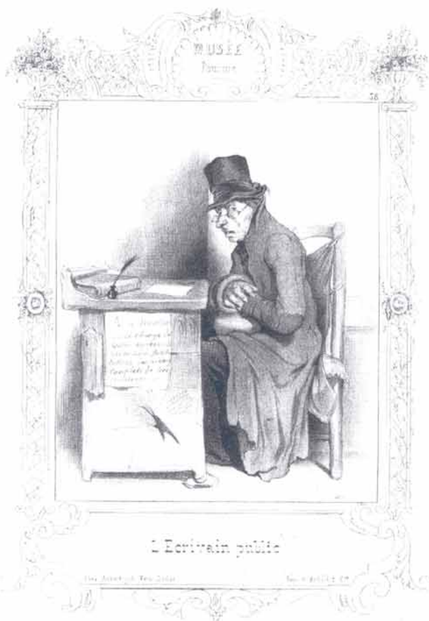
Naar Daumier, 19 e eeuw

Maar ondanks deze veranderingen blijft het amfibische karakter van de functie (zie Charivarius) in stand. De grens (waarover Charivarius spreekt) tussen de waardigheid van de onafhankelijke ambtenaar en de aardigheid van de koopman, die afhangt van zijn klantenkring, zal telkens verschuiven. Naarmate de func-