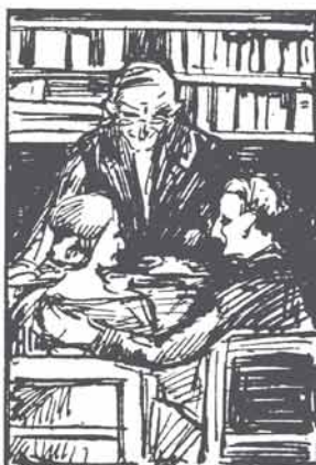
Als twee jonge mensen van elkaar houden, Dan helpt hij ze in optima forma trouwen.