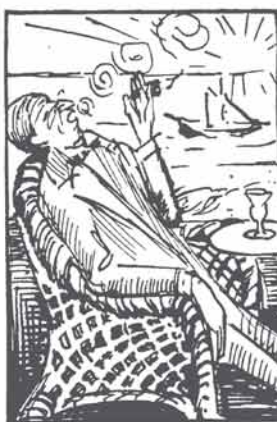
Ziet hoe rustig hij 't jaarlijksch verlof genieten gaat. Als vervanger ginds wetend zijn trouwen candidaat.