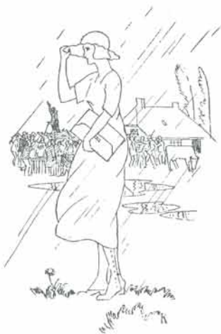
vrouwelijke kandidaat-notarissen, hoe amusant overigens, . . .