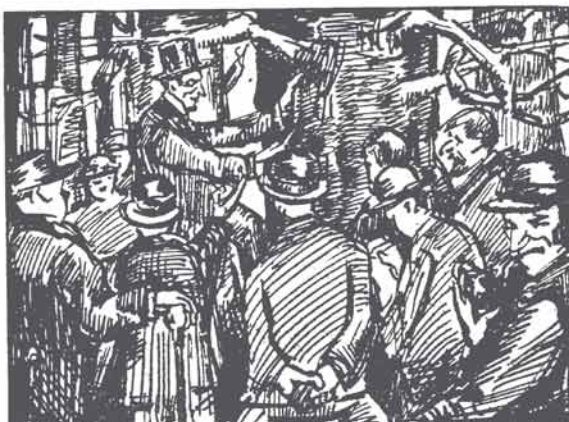
Langjaar'ge ervaring verruimt zijn verschiep: Met kammersoog veilt hij . . . en geeft hij crediet.