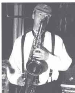
de promotus speelt op zijn promotiecadeau

trouwe krantenlezer kon kennis nemen van een succesvol beleggingsfonds van de ABN-Amro (Norships CV). Particuliere investeerders hebben door middel van dit beleggingsfonds kunnen participeren in de economische eigendom van twee schepen die op Engeland varen. De participaties à fl 86.000,- of een veelvoud daarvan waren in een recordtijd voltekend. Deze verhoogde interesse werd onlangs eveneens in de echte rechtsliteratuur bevestigd. Bij het invoegen en het daarbij behorende vluchtig doorlezen van het laatste supplement Personenassociaties 2 sprong cijfermatig materiaal in het oog. Slagter vergelijkt het aantal inschrijvingen van bepaalde rechtsvormen in de Nederlandse Handelsregisters per 1 januari 1976 met inschrijvingen per 3 mei 1996. Hij constateert dat het aantal bij de Kamers van Koophandel ingeschreven commanditaire vennootschappen in de onderzoeksperiode fors is toegenomen: van 2727 tot 7443 stuks. Afgerond - als ik het goed uitreken - een groei van 273%! Ter relativisering van deze spectaculaire ontwikkeling moet overigens worden opgemerkt dat hetzelfde voorwoord vermeldt dat op 3 mei 1996 maar liefst 402 497 besloten vennootschappen waren ingeschreven. Meer beeldend betekenen deze cijfers dat tegenover iedere CV ongeveer 54 BV's staan. De rechtsvorm commanditaire vennootschap is, zo blijkt uit bovenstaande cijfers, niet geheel zonder belang. De maatschappelijke relevantie dient anderzijds ook niet overtrokken te worden.