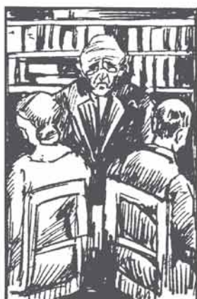
Is later, helaas, de „schoone droom“ voorbij, Dat elk 't zijne krijgt, daarvoor zorgt hij.