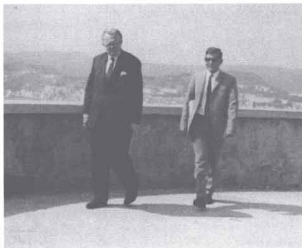
Een pas achter de meester in Italië, 1968