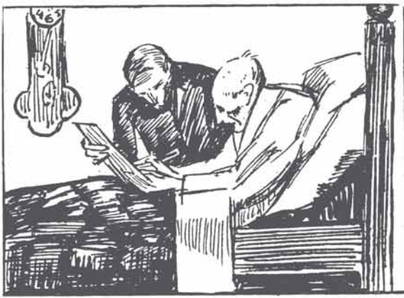
Als aan alles zoo komt ook aan 't leven een end, De notaris zorgt voor een keurig testament.