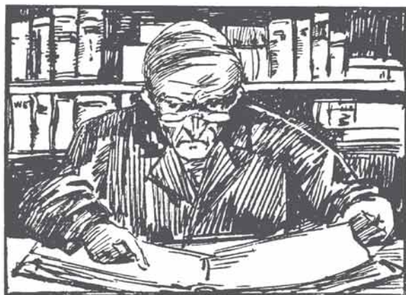
De Notaris is een gewichtig man. Die bij leven en sterven helpen kan.

De doorsnee notaris had in 1922 een iets andere opvatting van zijn professie.