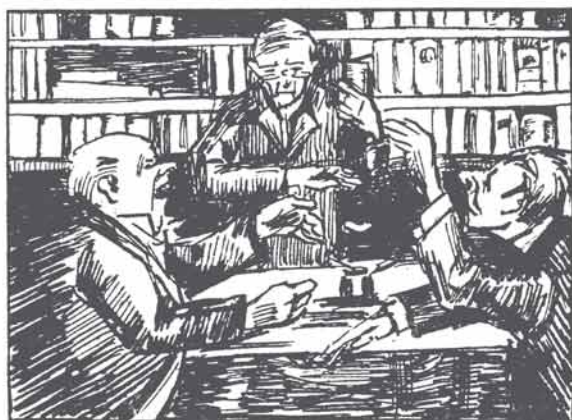
Gaan de eroven twisten bij boedelscheiding, Tenslotte beslist zijn deskundige leiding.